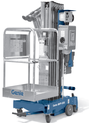
(1) Sólo en recambios (2) Opción sólo instalada en fábrica.